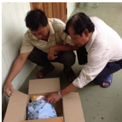
My Tam abandonnée à notre orphelinat

Dès réception de votre versement, nous vous envoyons une lettre de remerciement qui fait également office de donation pour votre déclaration d'impôts. (nous sommes reconnus comme association de pure utilité publique)