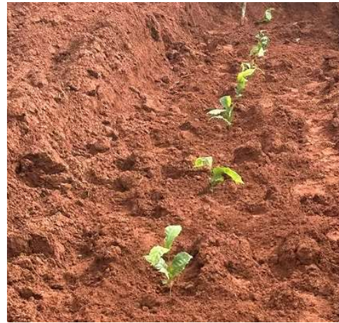
La terre rougeâtre de la région est de très bonne qualité