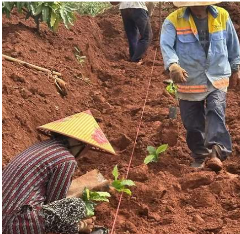
Juillet, août, la plantation des plants de caféiers a commencé