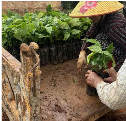
Les premiers caféiers sont arrivés en juin sur notre site de Chư Prông

Les bénéfices de la vente des fruits sont destinés à pérenniser entièrement tous les coûts de notre orphelinat, ces derniers ayant fortement augmenté suite aux exigences des autorités locales et au prix du gaz et de l'électricité qui a flambé.