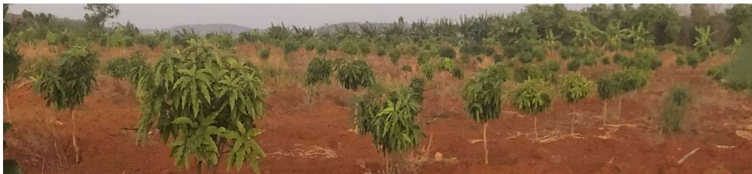
Sur cette parcelle, nous avons également plus de 4'000 manguiers qui produiront des fruits déjà en 2026