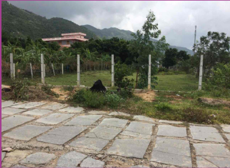
Préparation de la parcelle