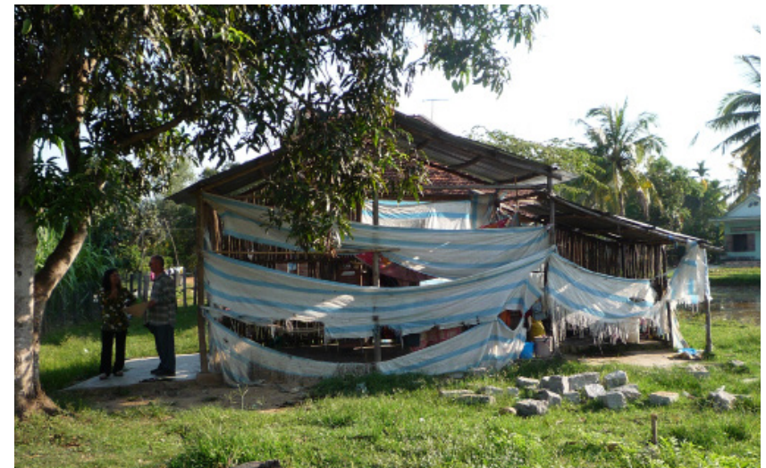
2008, première maison sélectionnée pour être reconstruite

Tous nos projets sont réalisés sur demande de la population locale. Ils sont conçus afin de pouvoir fonctionner, sur le long terme, sans soutien extérieur, uniquement grâce aux compétences et dévouements de la population locale.