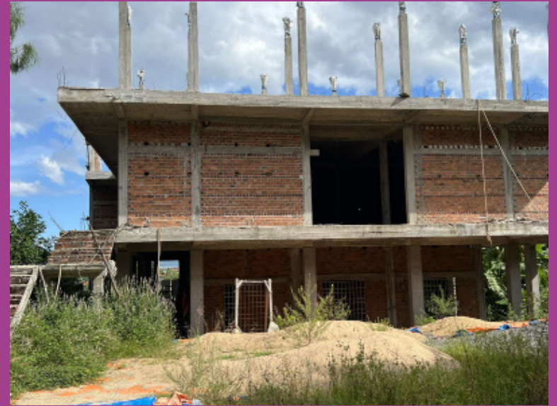
Premier niveau de l'école