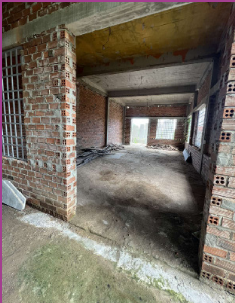
Une des 6 classes