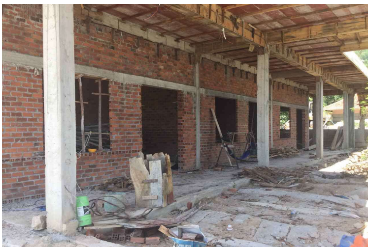
Juin 2021 Coulage de la dalle et de l'avant-toit