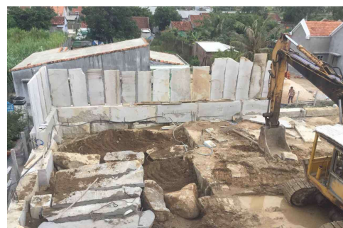
Septembre 2021 Fondations de la deuxième aile