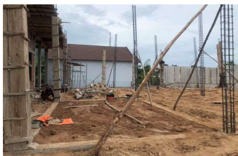
Octobre 2021 Couvert reliant les classes