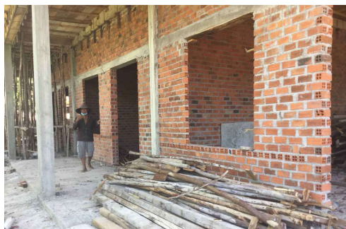
Septembre 2021 Couvert reliant les classes