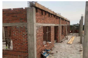
Mai 2021 Préparation de la dalle et de l'avant toit du premier étage