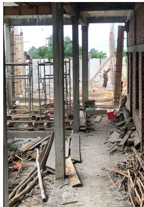
Octobre 2021 Construction du couloir d'accès à la deuxième aile