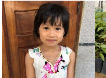
Bui à la fin de cette année