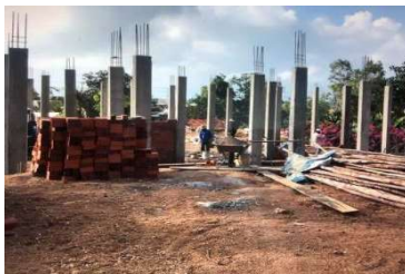
Avril 2021 Elévation des piliers