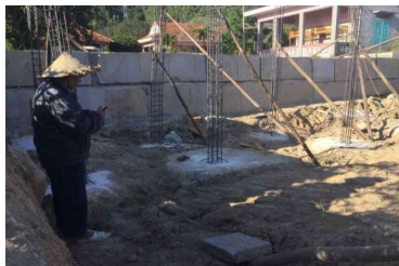
Décembre 2020 Mur de soutènement entre notre orphelinat (arrière plan)