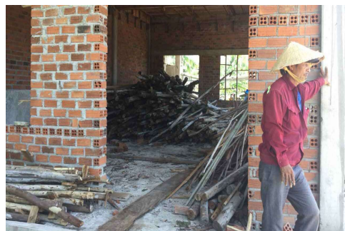
Septembre 2021 Une des classes de 40m2

Un toit en bois est beaucoup plus onéreux que de couler une dalle d'autant plus que nous avons toutes les matières premières requises sur notre site.